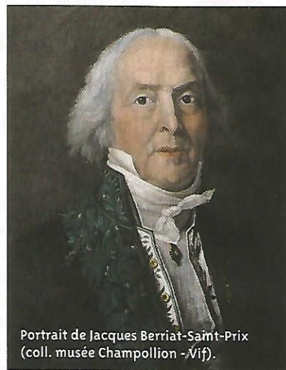
Portrait de Jacques Berriat-Saint-Prix.

« Dans la plupart des villes, la vidange des latrines ou fosses d'aisance est une charge pour les habitants. À Grenoble, c'est surtout devenu une source de revenus pour tous ». À l'origine, les Grenoblois payaient les fermiers des environs qui se chargeaient de procéder à cette évacuation nécessaire et nauséabonde, avant de réaliser tout le bénéfice que ces derniers pouvaient tirer avec l'amendement des cultures. Dès lors, ce sont les fermiers des Granges près de Grenoble qui paient pour le produit des latrines urbaines améliorant leur production, par ailleurs vendue au plus haut prix aux habitants coproducteurs de la matière... première et préalable ! L'accroissement de la population et celle du territoire agricole nécessitant l'amélioration des engrais composés de fumier de bovin et de cheval, de paille, de foin,