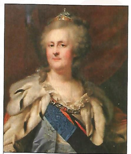
Portrait de Catherine II de Russie, par J.-B. Lampi.

Le sujet de la monstruosité dramatique que les Grenoblois vont rejeter est ainsi rapidement résumé : un vieillard, victime de despotisme royal en France, est exilé depuis vingt ans sur une île déserte et « volcanisée », lorsqu'il a la surprise de voir débarquer des Européens sans-culottes tenant en laisse leurs monarques détrônés respectifs : l'empereur d'Autriche, le roi d'Angleterre, celui de Prusse, celui de Naples, l'impératrice de Russie délicatement surnommée « La Catin du Nord » ou « L'Enjambée », ainsi que le pape Pie VI dont le rôle est interprété par le comique de la troupe. Injuriés, vilipendés, les ex-souverains se battent entre eux, avant d'être abandonnés sur place par leurs géoliers