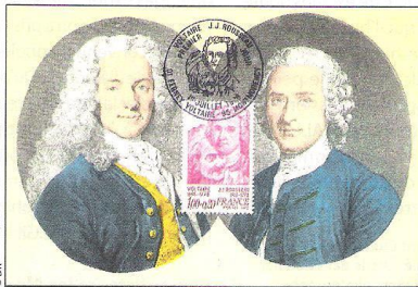
Voltaire et Rousseau.

Je ne sais pas, mais il me semble que certains puissants auraient, aujourd'hui encore, intérêt à lire l'utopie grenobloise du grand comédien, non ?